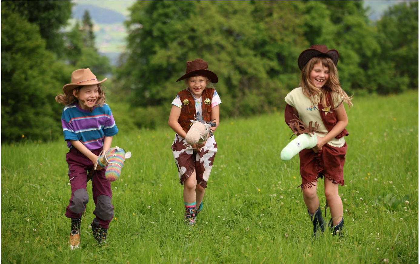
Im Fanglager schliefen wir ein Woche lang in Zelten und lebten wie im Wilden Westen.