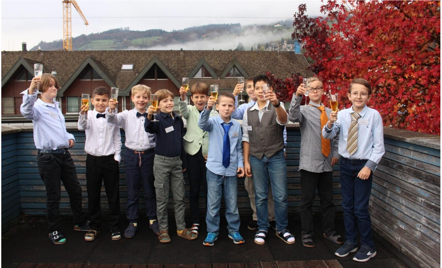
«Be the Boss» Businessmeeting auf der Mittelstufe (die Damen und die Herren wollten nicht gemeinsam aufs Foto).