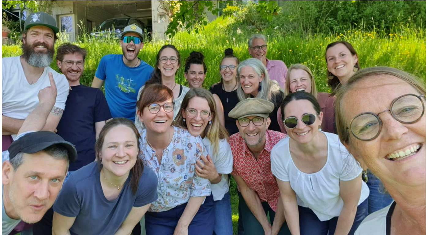
Besuch und anregender Austausch mit dem Team der Wirkstadtschule Elfingen.