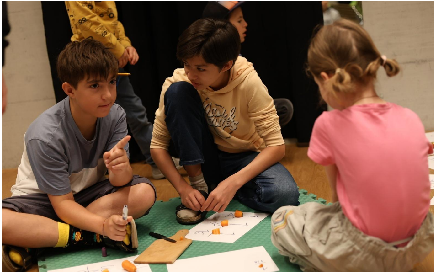
Im Mathiversum arbeiten die 5–6-Jährigen jeweils gemeinsam an einem mathematischen Thema, hier waren es die Brüche.