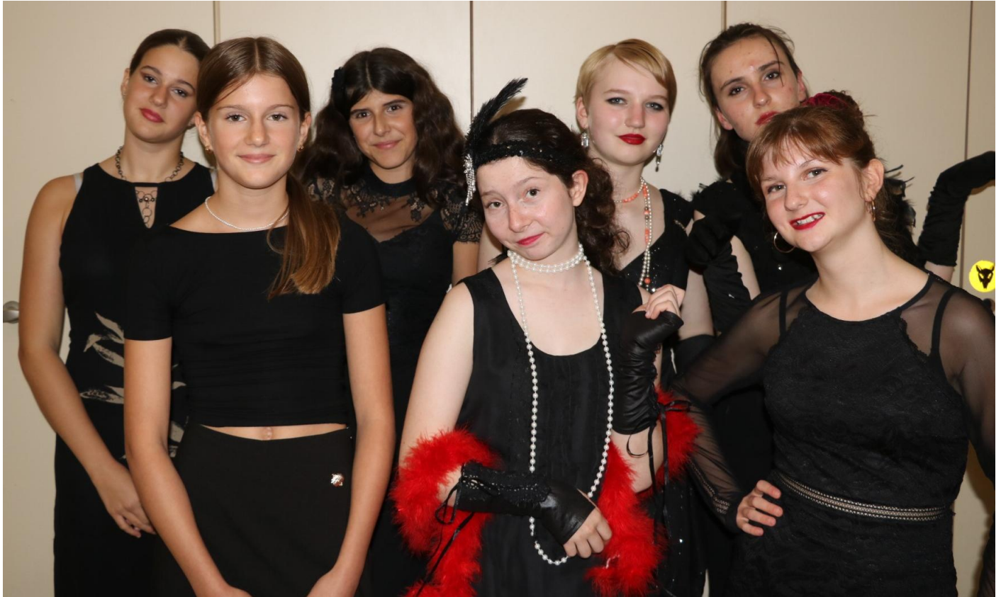
Die Oberstufengirls sind bereit fürs Krimidinner.