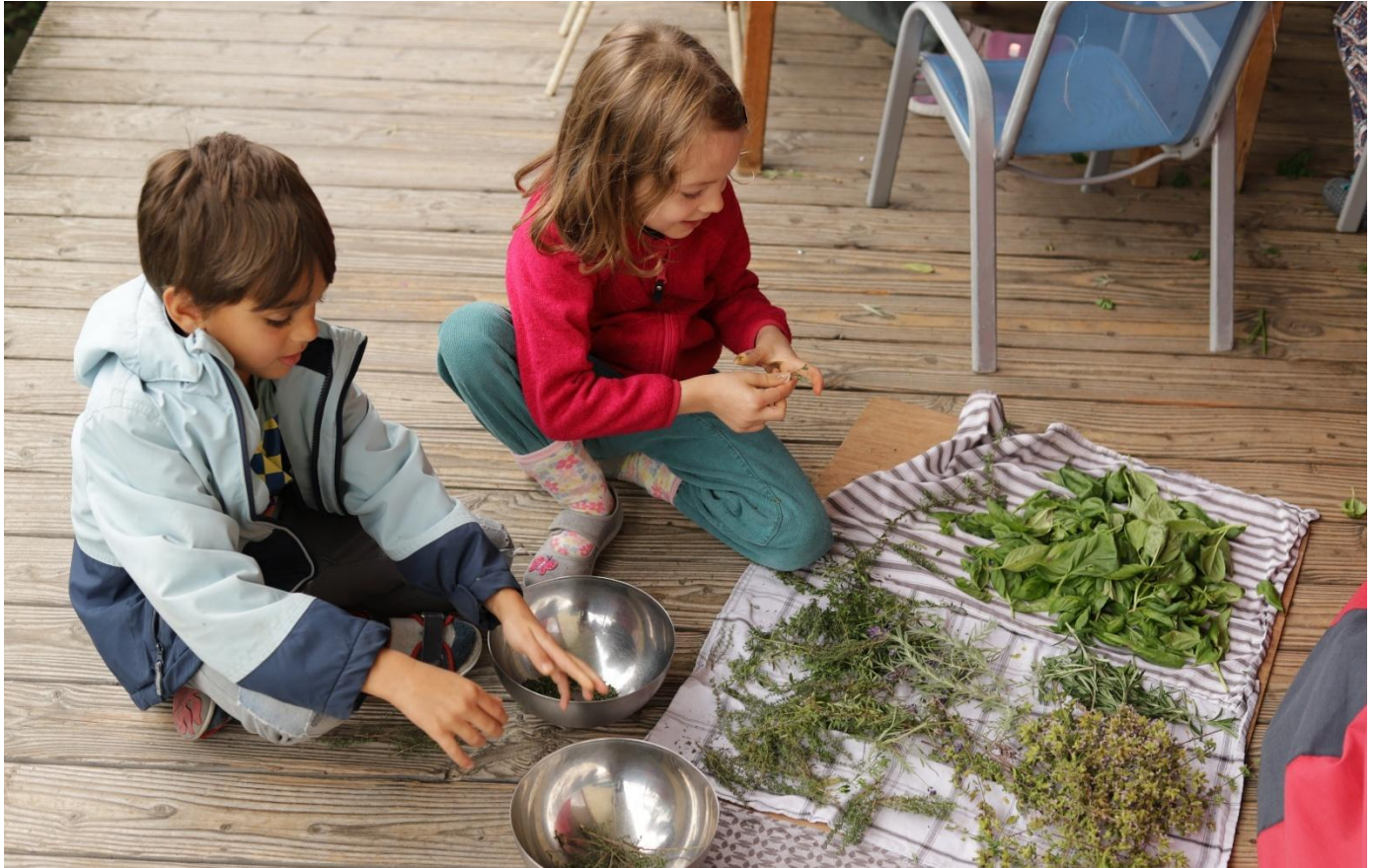
In der Basisstufe sammelten die Kinder Kräuter, um daraus Kräutersalz fürs Kramorama zu machen.