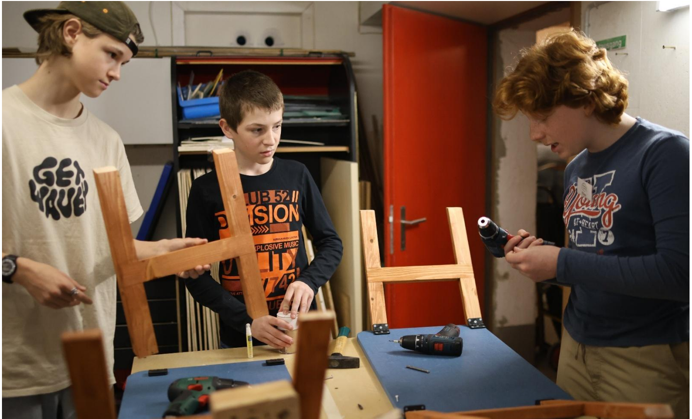
Diese Schüler entwickelten und produzierten einen Klappstuhl, den sie im Kramorama verkauften.