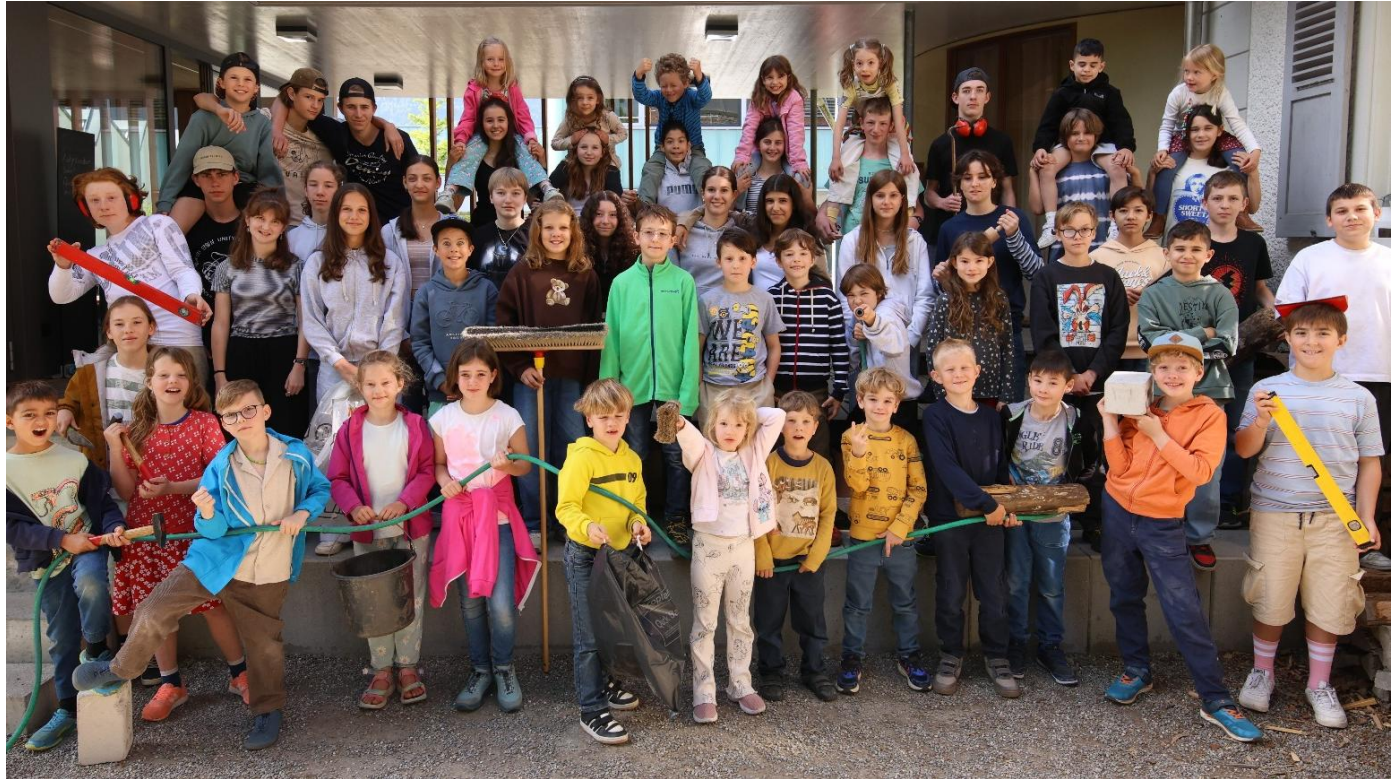
Das sind sie, die Grundkids 2024/25.